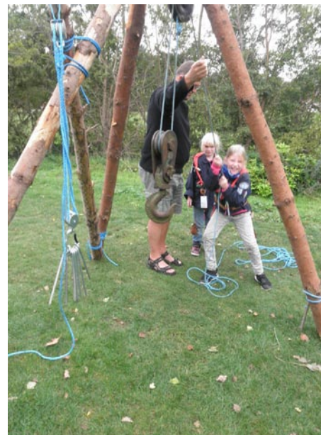
Spejdere løfter tunge ting.

med at bygge en blide for at forsvare kongen.