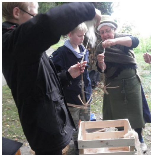
Der laves garn ved hjælp af toppen af et juletræ.

... og så bliver de selvspundne tråde brugt!