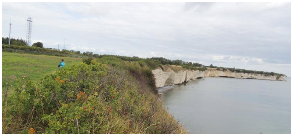
Et lille kik hen af Stevns-Klint ved Stevnsfortet, hvor hav og land mødes.

På trods af den lidt kaotiske afslutning blev det alligevel en god vandretur.