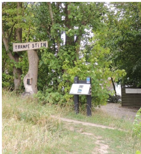
Boesdal med startskiltet for trampestien.

Medens snakken lystig gik i takt med benene blev den smukke og særprægede udsigt nydt i fulde drag, og der var meget at se på. Vejret var klart og godt så man kunne se langt, der var derfor udsigt helt til Møns Klint, Øresundsbroen, Sverige og mange små – meget små – øer i skøn blanding med større og mindre sejlbåde og store motordrevne skibe. Et par havkajakker var der også plads til.