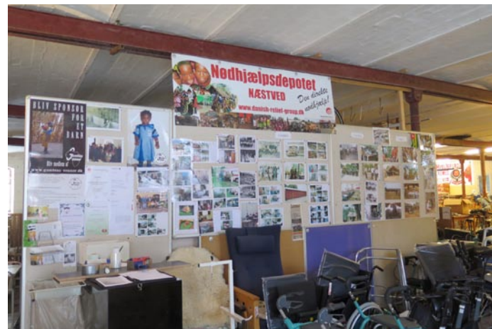
Nødhjælpsdepotet på Rønnebæksholm