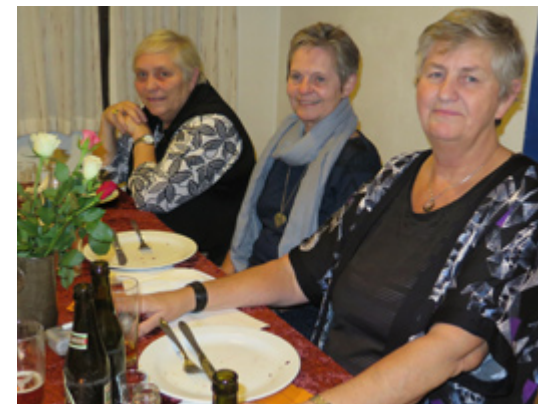
Gildebødre fra Maribo

I efterhallen blev der holdt flere taler til vores nye medlem, bl.a. fra en af gil-