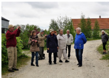
Gildebrødre beundrer de forskelligartede huse og haver.

Da vi ikke skulle gå glip af eftermiddagskaffen, kørte vi til den gamle grusgrav i Ugledigesvinget og indtog denne,