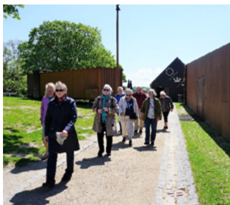
Efter at have set og nydt opholdet på Borgcentret i Vordingborg og dens vikingedstilling gik turen videre. Her forlader gildebrødrene Borgcentret.