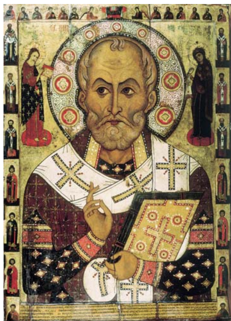
Biskop Nikolaus af Myra.

går man med livrem og seler og fejrer både Jesus fødsel og julemandens (Sankt Nikolaus) dødsdag og der vanker gaver begge dage.